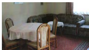
60 qm Wohnung