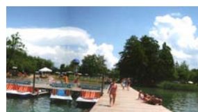
Badestrand am Klopeinersee für alle Wohnungen in St. Kanzian und Gallizien