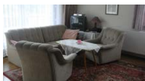
70 qm Wohnung